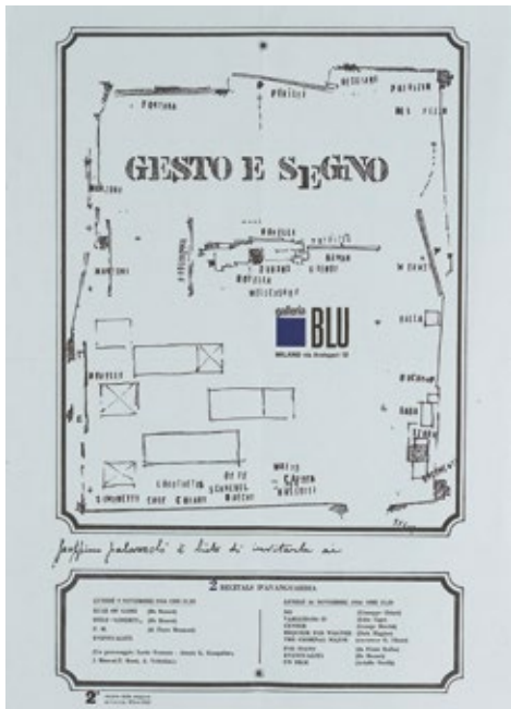
Gesto e Segno , Manifesto della mostra su progetto di Gianni Emilio Simonetti, Galleria Blu di Milano, 1964